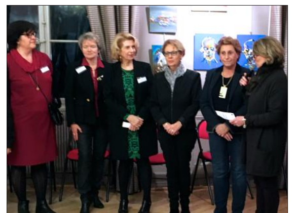
■ Jeudi soir, le vernissage a réuni une nombreuse assemblée.